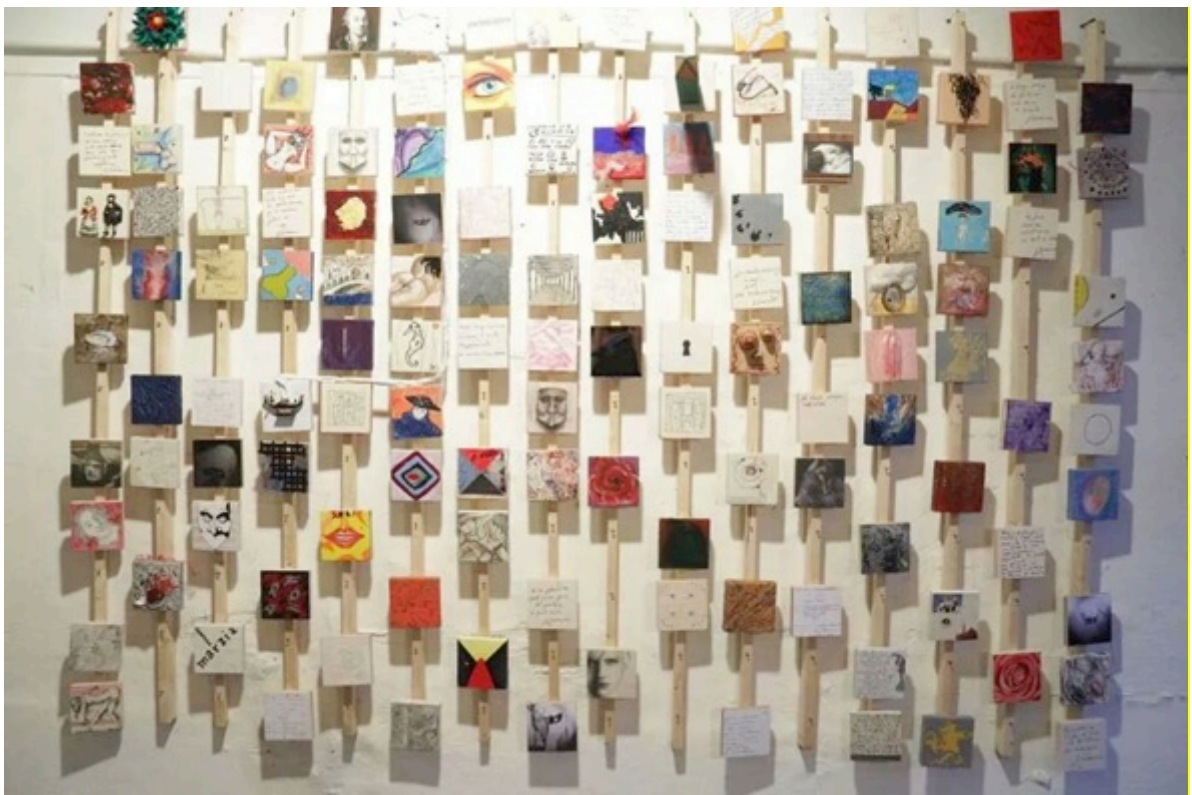
2 de abril del 2014, Carrión Gallery

El dos de abril de 2014 se puso en marcha, en la ciudad de Venecia, Italia, la iniciativa de crear una obra colectiva compuesta de 1.160 personas, con obras de 10 cm x 10 cm que es el formato escogido que cada persona se pueda expresar libremente con cualquier técnica para reflexionar y conocer sobre la figura de Giacomo Casanova, que nació en Venecia el 2 de abril del 1725 en una suerte de continuo working progress. El mosaico ha conquistado un público internacional y local para asegurar que este personaje no quede en el olvido, ya que al momento en el gran público se lo conoce por sus aventuras amorosas, pero no por ser uno de los hombres con mayor cultura europea del siglo del XVIII.